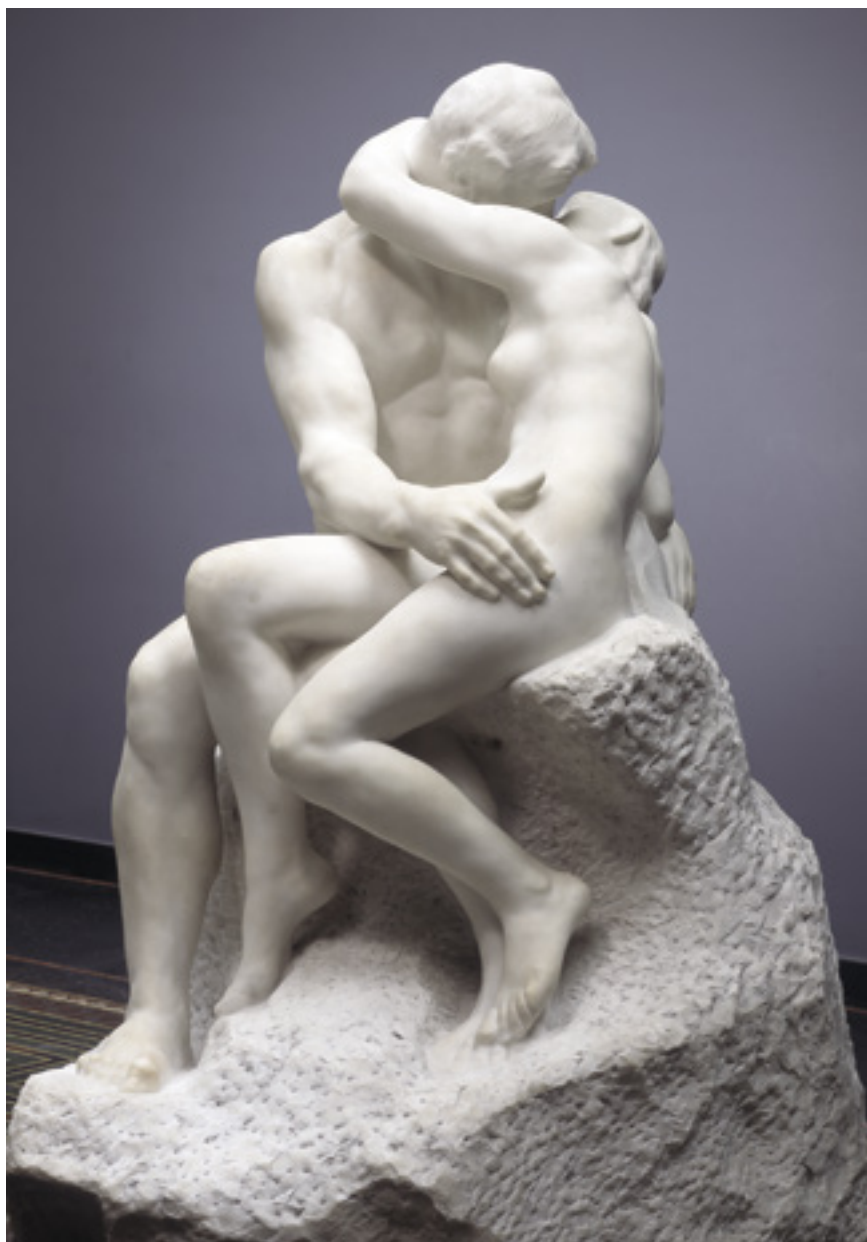
Auguste Rodin, Kysset. Statuen blev bestilt i år 1900 sammen med "Borgerne fra Calais" og fire andre kendte Rodin-skulpturer.