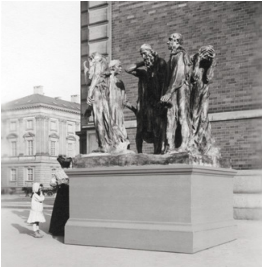
Auguste Rodin, Borgerne fra Calais. Gruppen ankom til Glyptoteket i 1904 og blev opstillet udenfor på hjørnet af det daværende Søndre Boulevard og Tietgensgade.