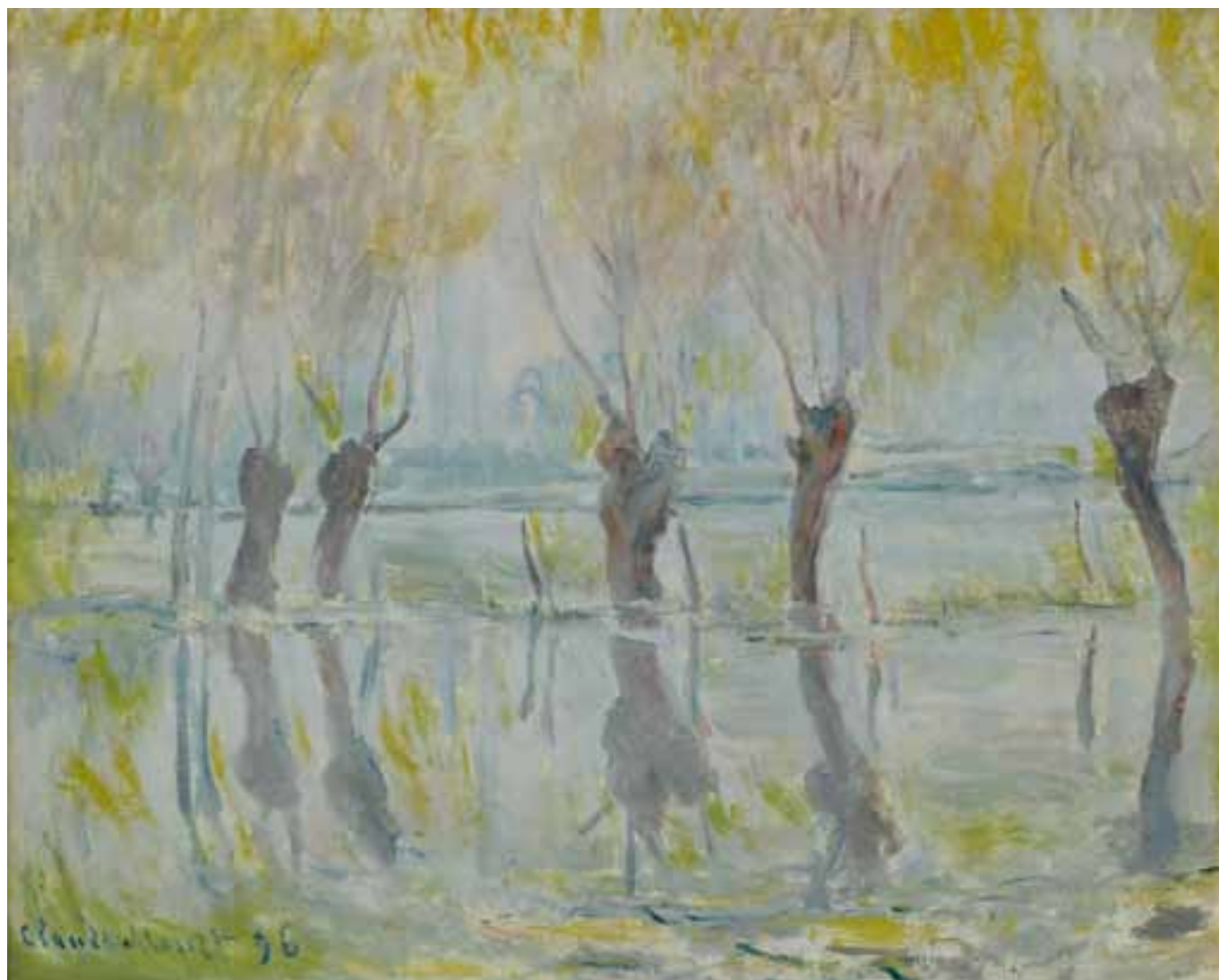
Claude Monet: Inondation à Giverny, 1896. Olie på lærred.