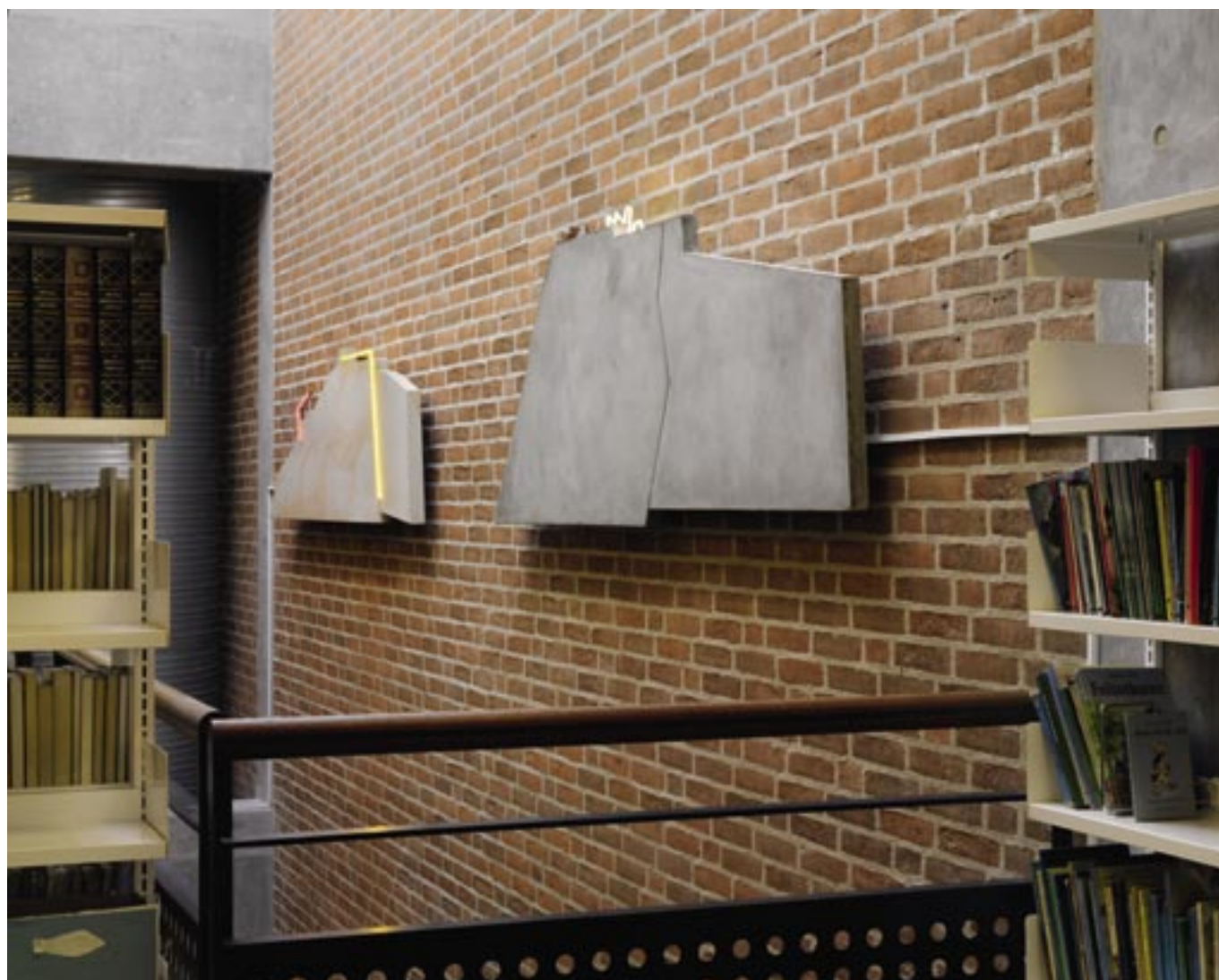
Kirsten Lockenwitz: Andrah III. 1998. Neonrelief, beton, kobber, argon.