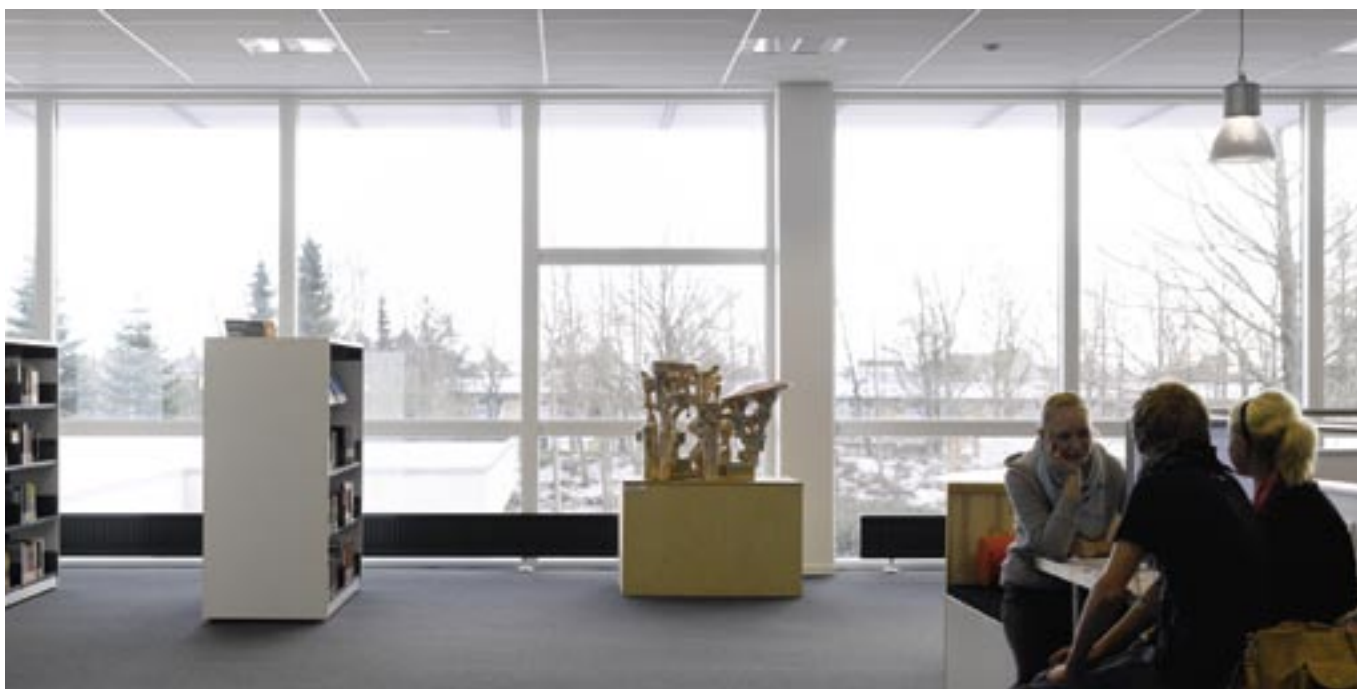
Nils Erik Gjerdevik: Uden titel. 2006. Stentøj.

andre mennesker og forstå os selv. Kunsten viser os noget, vi aldrig har set før, den skaber billeder, man ikke kan se noget andet sted, den omfortolker verden for os, så vi ser på nye måder, så vi ser verden på ny, så vi bevarer nysgerrigheden.