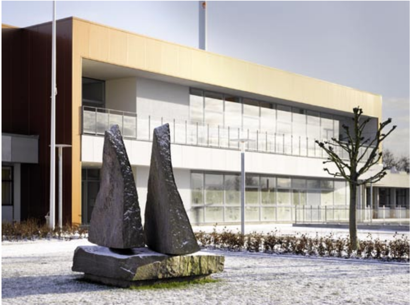
Erik Heide: Sejl. 2007. Halmstadgranit.

ning var at skaffe mere plads og rum på skolen, som i sin nuværende placering i øvrigt har til huse i et lavt betonbyggeri fra 1970'erne. Det var arkitektfirmaet Friis & Moltke, der løste opgaven efter skolens udtrykkelige ønske om, at der i den nye bygning skulle være højere til loftet og et videre udsyn, både bogstaveligt og billedligt, end den gamle bygning kunne præstere. Den nye bygning har derfor fået store, rummelige fællesarealer til kantine, videnscenter, auditorium, amfiteater og andet og er bygget i et nymodernistisk formsprog med enkle rumformer og store vinduespartier, der minder om, at der er en verden udenfor. Det var i anledning af denne udvidelse og af jubilæet, at Ny Carlsbergfondet atter supplerede skolens gode intentioner med kunst.