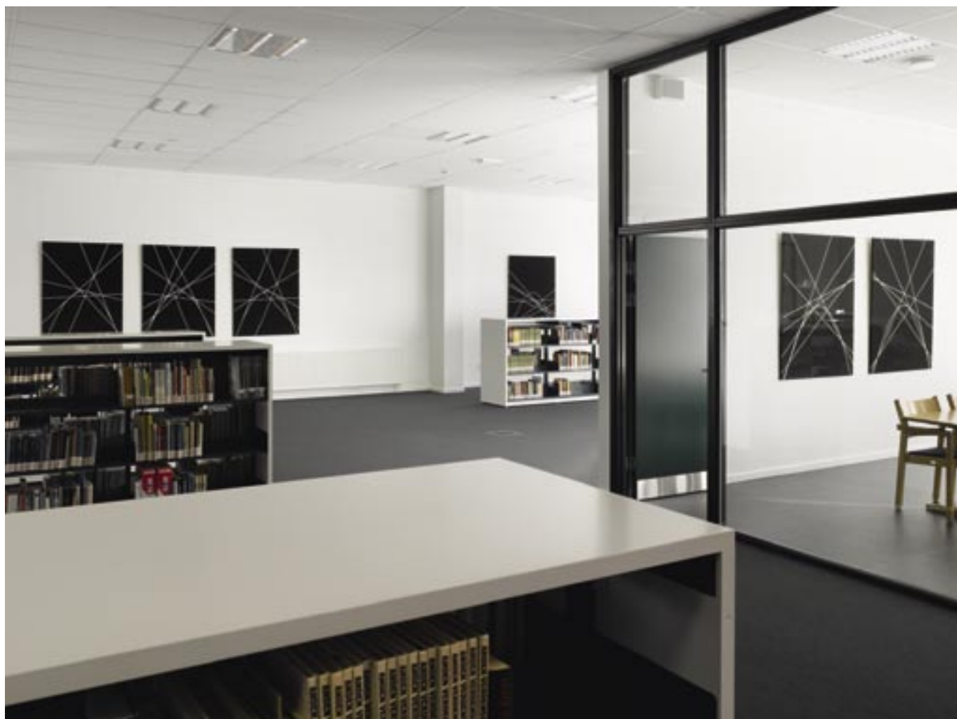
Steffen Jørgensen: Pascal-Briançon figurer. 2005. Akryl på lærred.