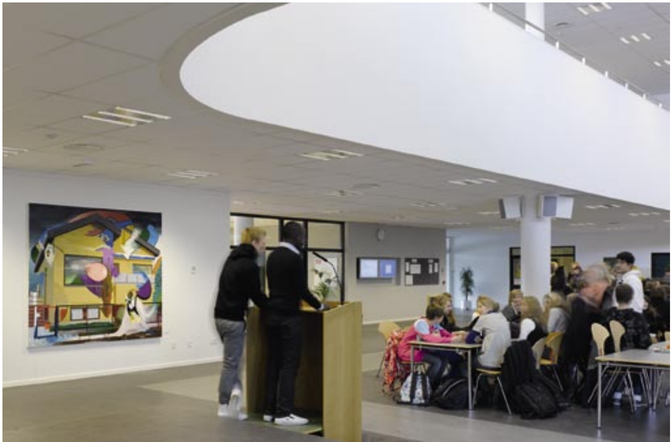
Ivan Andersen: Bad Luck Blackie. 2008. Olie og akryl på lærred.

Det gør det, fordi det at lære har at gøre med nysgerrighed efter at forstå verden. Og det er også det, der er på færde i kunsten. Kunsten er en måde at udforske verden på, både for kunstneren og for os, der betagter kunstværkerne. Værkerne hjælper os til at undre os over og få blik for alt muligt og umuligt. Det er vigtigt at undre sig, det er vigtigt at være nysgerrig, for det er dét, der får os videre som mennesker. Det gør, at vi kan synes, det er sjovt at lære noget. Vi har et grundlæggende ønske om at forstå verden, forstå