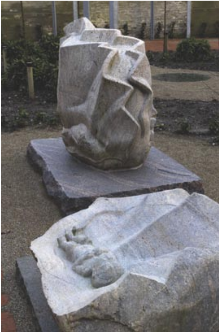
Ejgil Westergaards udsmykning til hospicet i Esbjerg.