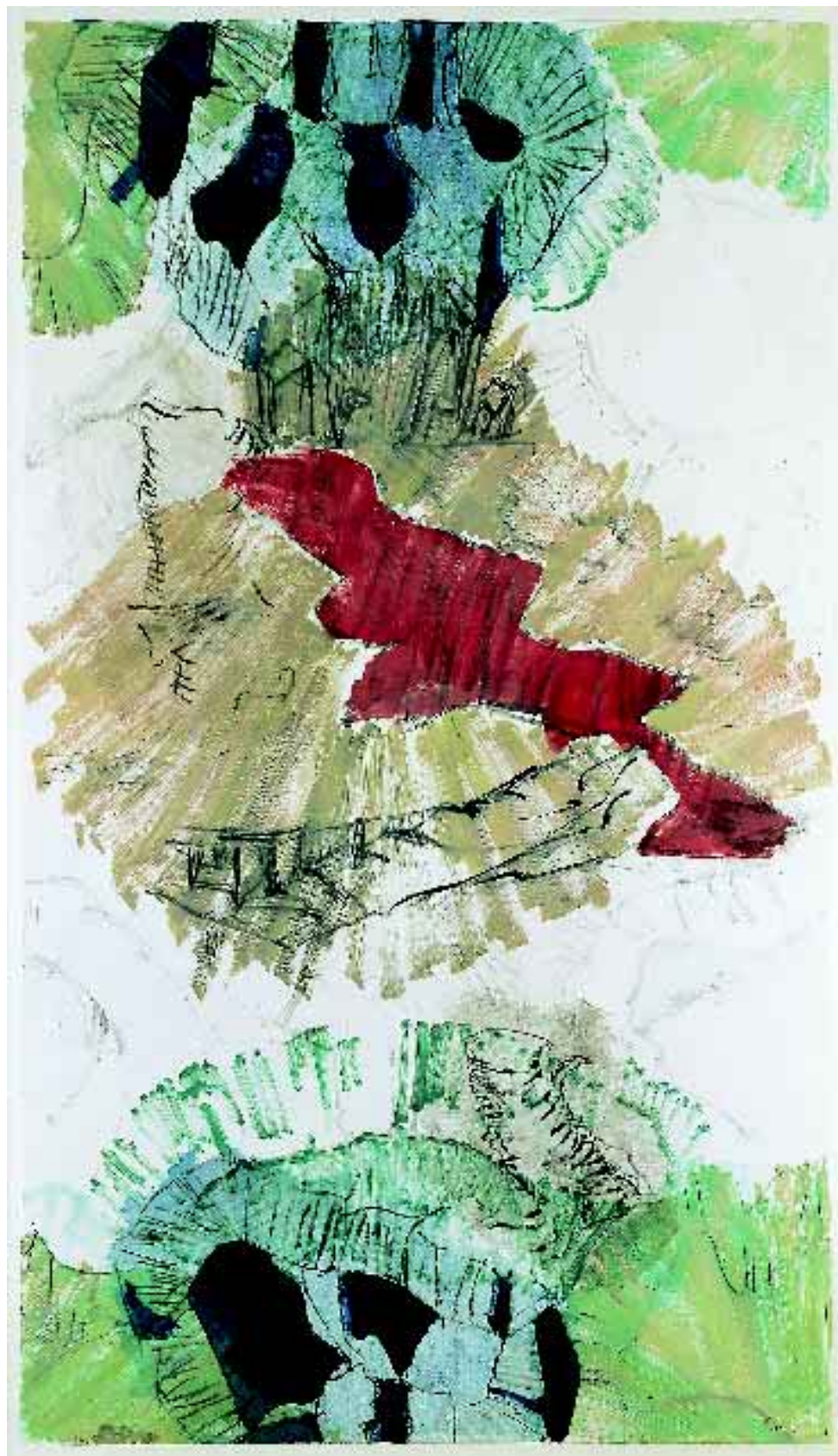
Per Kirkeby: Monotypi. 2000. Planet Foto: Bent Ryberg.