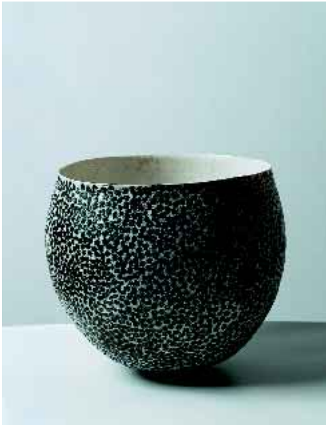
Jane Reumert: Puppe med vækstspor. 2000. Keramik. Planet