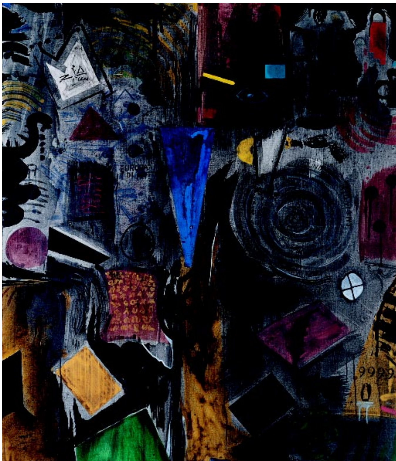
Bent Karl Jacobsen: Round Midnight. 1999. Akryl på lærred.