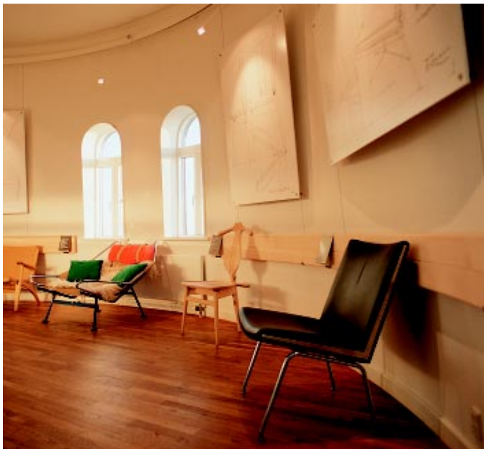
Fra et af vandtårnets udstillingsdæk med Wegner-stole og tilhørende konstruktionstegninger.